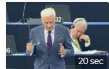
Imagen interactiva del Parlamento Europeo.